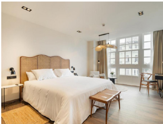
Hotel Esteoste **** Praza de Santo Domingo, 1 27001 LUGO Tel. 982 68 81 12