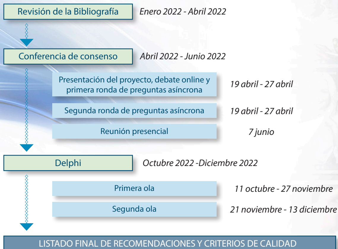
Figura 1. Esquema del proceso seguido durante la investigación cualitativa.

El proceso se desarrolló entre abril y diciembre de 2022, después de una fase previa de revisión de la bibliografía. El esquema completo del proceso se puede observar en la Figura 1 .