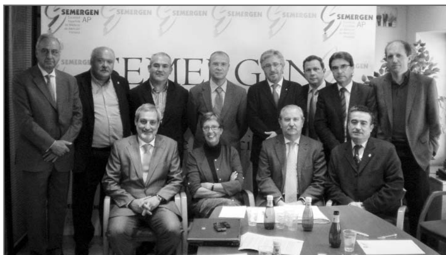
Sociedades reunidas el pasado 18 de octubre en la sede de SEMERGEN

e Igualdad, competente en la financiación de fármacos, un sistema que tenga en cuenta el código deontológico de la profesión y que no coaccione la actuación médica.