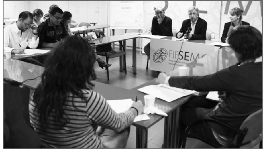
Representantes de la SEMG dan a conocer FIFSEMG en un encuentro con la prensa