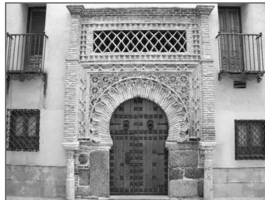
Puerta de entrada al Palacio de Benacazón

fachada principal), lo han convertido en un lugar idóneo. Un destacado edificio de Toledo que permitirá albergar alrededor de 150 congresistas que durante tres días podrán actualizar sus conocimientos gracias a las 7 actividades de este encuentro científico.