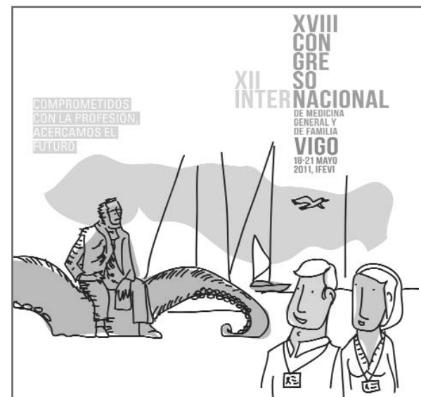
Imagen del XVIII Congreso Nacional y XII Internacional de Medicina General y de Familia

Congreso para conocer de cerca su sistema de AP y que tengan alguna actividad propia que permita aunar modus operandis y que despierte el interés de los asistentes”, destaca el presidente del Congreso.