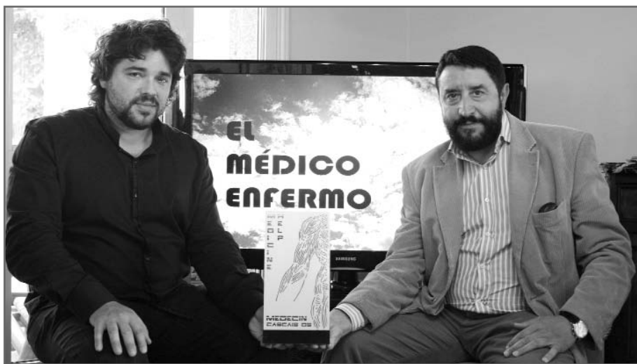
Presentación de la nueva Cátedra en la Facultad de Medicina de la Universidad de Cádiz

El documental "El Médico Enfermo. Una mirada propia", coproducido por la Fundación SEMG-Solidaria y la Fundación Patronato de Huérfanos de Médicos Príncipe de Asturias, ha recibido el primer premio en la categoría MedHelp del festival internacional de cine médico celebrado en Cascais del 16 al 19 de septiembre.