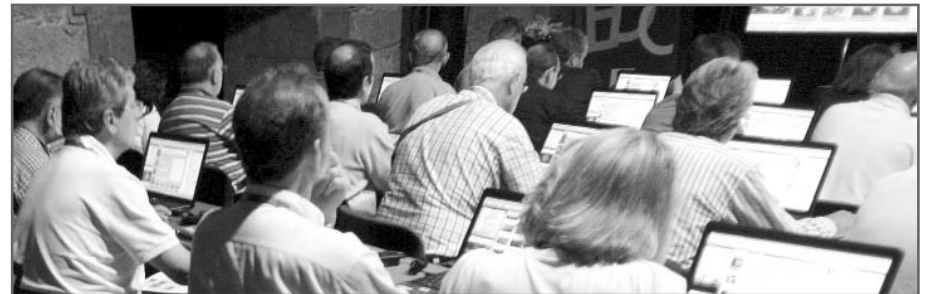
Tras el éxito de Oviedo el Congreso de Granada se presenta como un gran reto

Granada funde un atractivo cultural con lugares adecuados para celebrar el Congreso como es el Palacio de Exposiciones que tiene capacidad para albergar a los más de 3.000 congresistas que cada año se reúnen. El edificio cuenta con amplios espacios donde llevar a cabo todas las actividades de forma simultánea y dando cabida a un gran número de inscritos, además los asistentes podrán comer juntos en el mismo recinto, lo cual supone aprovechar al máximo el Congreso. Para conseguir que así sea, los comités organizador, científico y de congresos ya están trabajando, con el objetivo de alcanzar como mínimo el éxito del último Congreso celebrado en Oviedo.