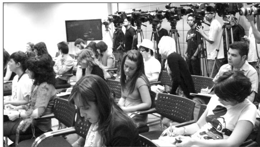
La presentación del curso formativo sobre gripe A levantó una gran expectación entre la prensa

que en estos momentos se está estudiando realizar una segunda edición. Teniendo en cuenta el volumen de la demanda, es posible que en las próximas semanas tenga lugar un nuevo curso online para cubrir las necesidades de más facultativos. Aunque los socios de la SEMG también tienen la oportunidad de acceder al área privada de la página web donde estará a su disposición la parte formativa elaborada por la Sociedad.