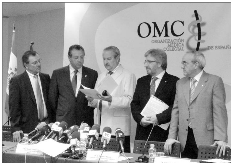
Representantes de las organizaciones promotoras durante la presentación del curso a la prensa