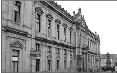
Facultad de Medicina de la USC

Las áreas de estudio son nueve y están desarrolladas en 13 talleres: técnicas y habilidades en comunicación; estilos de vida y Medicina de Familia; ecografía; drenaje de absesos; técnicas de sutura; infiltración local en patología de hombro y codo y en la de muñeca y mano; apertura de la vía aérea (intubación y cricotirotomía); RCP y desfibrilación semiautomática; decisiones prácticas en