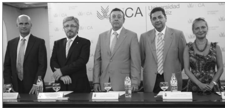
Presentación de la nueva Cátedra en la Facultad de Medicina de la Universidad de Cádiz

Medicina de Familia de la Universidad de Santiago de Compostela y a la Cátedra SEMG-Pfizer de Estilos de Vida y Comunicación en Salud de la Universidad de Zaragoza. Este septiembre se pondrá en marcha la primera edición de la nueva Cátedra de Cádiz, mientras que será la segunda edición para la Cátedra de Zaragoza y se cumplirá el tercer año de la Cátedra de Santiago.