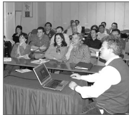
Una de las clases teóricas del curso