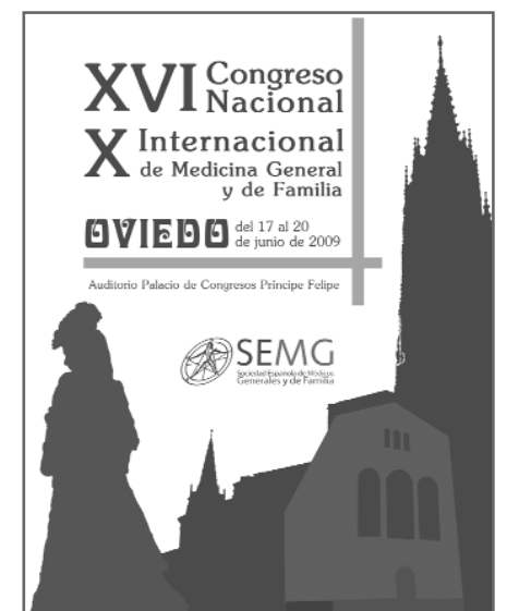
Imagen del Congreso

Por supuesto estarán presentes aspectos de tanta importancia para la SEMG como son la investigación científica, la ecografía clínica y la informática para médicos, que contarán con áreas propias, así como el espacio destinado a la Fundación SEMG Solidaria a través del Foro Iberoamericano. Entre los talleres prácticos: manejo del dolor abdominal en Atención Primaria, exploración neurológica básica, habilidades en patología prostática o exploración en ORL, insulinización en AP, manejo de arritmias, diagnóstico de sinovitis en la artrosis, valoración y tratamiento precoz del politraumatizado, exploración e infiltración de miembro superior, habilidades en dermatología, comunicación y estilos de vida o exploración vascular. Las mesas de controversia de esta edición