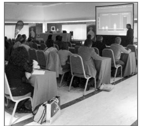
Celebración del I Encuentro Galaico-Astur

También se consideraron las peculiaridades del paciente diabético anciano, para no incurrir en un tratamiento muy agresivo, valorando su estado actual y su esperanza de vida.