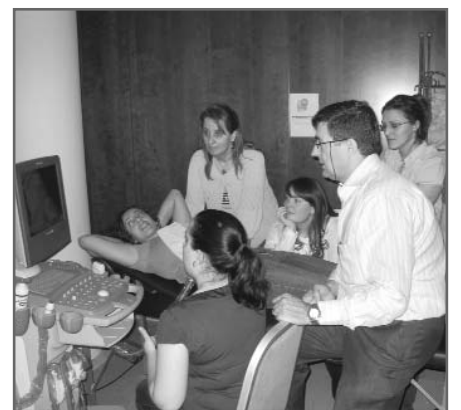
Imagen de uno de los talleres