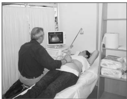
La ecografía, integrada en la práctica habitual

La SEMG ha sido desde siempre pionera en la defensa y promoción del uso de la ecografía como técnica diagnóstica integrada en la práctica habitual del médico general y de familia, de altas capacidades resolutivas. Y, a día de hoy, esta sociedad científica sigue siendo referente en la formación de ecografía clínica. En marzo se ha celebrado el XLVI Curso de Ecografía Clínica, un curso que ya es todo un clásico de la SEMG. Y de nuevo una muy alta valoración de los alumnos, que lo puntúan entre 9 y 10.