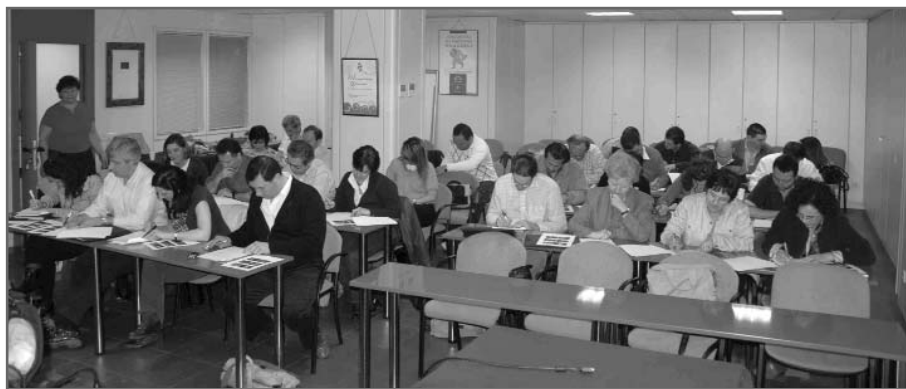
Los alumnos del curso durante la celebración del examen