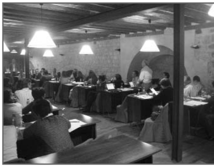
Momento de las Jornadas Castellano-Leonesas

Tras la creación de cinco grupos de trabajo orientados hacia cinco áreas de la medicina (riesgo cardiovascular, diabetes, respiratorio, uso de antibióticos y deterioro cognitivo), se dieron los primeros pasos para la elaboración de las líneas iniciales de un proyecto de investigación. Además, se planteó a los participantes la posibilidad de formar parte de una red profesional para la investigación clínica en AP. Este paso, fundamental para dar continuidad a estas Jornadas, permitirá desarrollar los proyectos