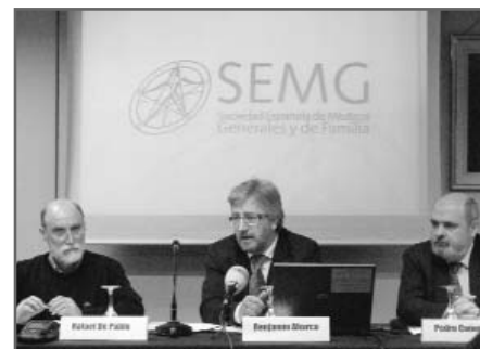
Momento de la rueda de prensa