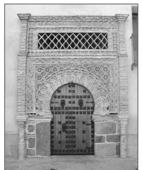
Palacio de Benacazón, sede del Congreso

El segundo día de Congreso, las actividades estarán centradas en tres mesas de debate. Las dos primeras mesas, haciendo referencia a la diabetes mellitus tipo 2 y a otras enfermedades cardiovasculares, analizarán los avances y los últimos objetivos terapéuticos. De esta forma, la segunda jornada se convierte en una monografía sobre diabetes, una de las enfermedades más prevalentes en las consultas de