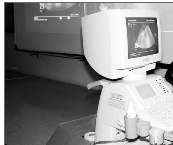
La SEMG ha sido pionera en la promoción del uso de

más de 40 cursos de 100 horas organizados, el próximo en diciembre