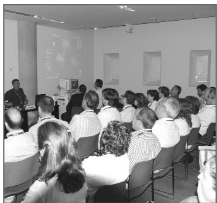
Imagen de un curso de ecografía

La presencia de la ecografía dentro de la SEMG alcanzó también a algunas de sus facciones autonómicas y comenzaron a aparecer diversas escuelas de ecografía a nivel regional. Poco a poco se formaron distintos focos en las comunidades autónomas de Galicia, Comunidad Valenciana, Cataluña y Aragón y también de forma incipiente en Castilla-La Mancha, Castilla y León y Andalucía. Además, la ecografía irrumpió también en internet de manos de esta sociedad científica y como consecuencia de la necesidad de intercambiar opiniones sobre imágenes y casos clínicos concretos, surgió en la red el Foro de Ecografía.