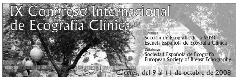
Imagen del Congreso