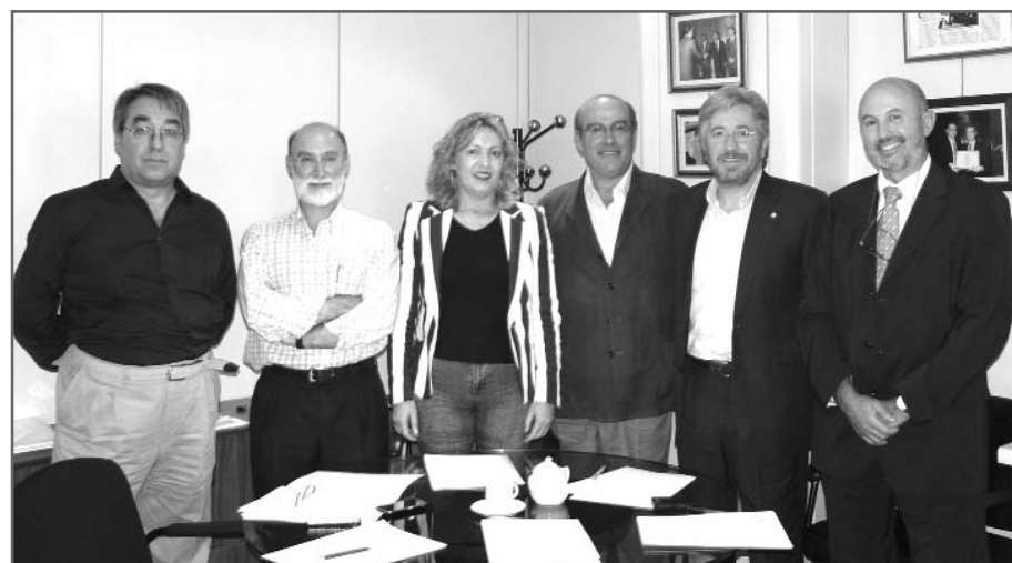
Algunos de los representantes de las organizaciones firmantes del Decálogo