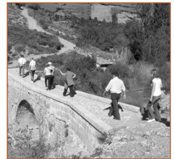
Marcha durante las Jornadas de SEMG-Aragón