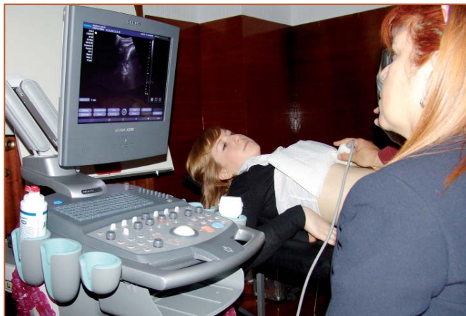
Imagen de uno de los talleres del Área de Ecografía