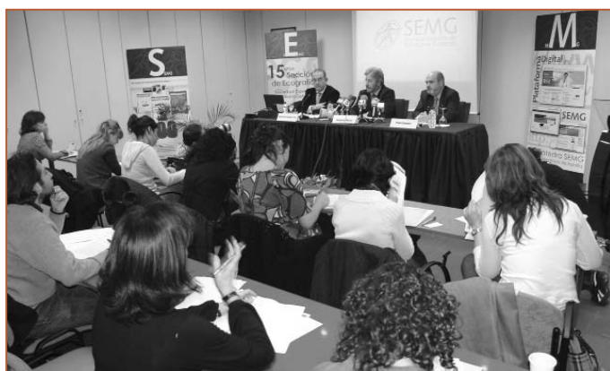
Momento de la rueda de prensa

Tal y como se había comprometido a hacer a raíz de los compromisos alcanzados tras las movilizaciones de la primavera pasada por la mejora de la Atención Primaria, la SEMG presentó en febrero a los medios de comunicación el informe El estado de salud actual de la Atención Primaria . A través de la recopilación de datos de