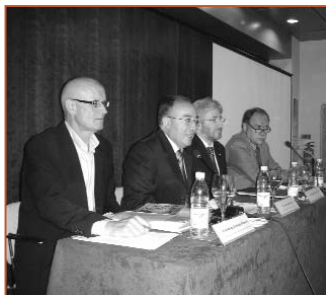
Mesa de las VI Jornadas Murcianas

El Grupo de Urología de la SEMG trabajaba en la puesta en marcha del Programa de Actualización práctica en patología Prostática en AP (APROS), avalado por la Asociación Española de Urología (AEU), SEMERGEN y semFYC, que consiste en la edición de una guía consensuada y la celebración de talleres dirigidos a los médicos de AP.