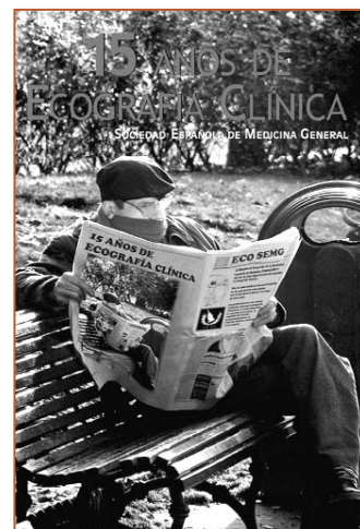
Portada del libro 15 años de Ecografía Clínica

La Sección de Ecografía Clínica de la SEMG cumplía 15 años y celebraba este aniversario con la edición de un libro que recoge su historia y todos los avances de esta herramienta diagnóstica desde que la SEMG, hace ya tres lustros, reivindicaba la necesidad y practicidad de su implementación en los centros de salud de toda España.