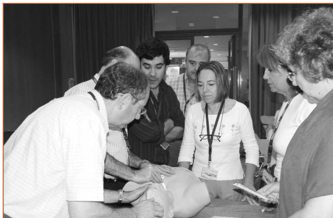
Los cursos de la SEMG abordan todas las áreas que competen al médico general y de familia

Octubre fue el mes de la vuelta a la normalidad con el inicio de los cursos y actividades de la SEMG. A finales del mes anterior se presentaba en Granada un nuevo modelo docente que completaría la oferta formativa de la SEMG. Bajo el título Formación y Evaluación Sistematizada en Infecciones Respiratorias (FES), se inauguraban los nuevos talleres con el objetivo de mejorar y actualizar los conocimientos en neumología de los médicos generales y de familia. Los talleres FES están basados en la interactividad: los alumnos que participan en las sesiones, de marcado carácter práctico, deben resolver casos clínicos reales de manera independiente desde su ordenador. La aplicación de las nuevas tecnologías, habitual para la SEMG, permite durante este curso y mediante un programa desarrollado específicamente para esta estructura formativa, el acceso a una historia clínica real que ofrece a los alumnos la oportunidad para que aborden las cuestiones diagnósticas y los tratamientos adecuados en cada caso, con total proximidad y fidelidad a las situaciones reales y a las herramientas de que se disponen en una consulta de atención primaria. Posteriormente los docentes pasan a efectuar la revisión y valoración de