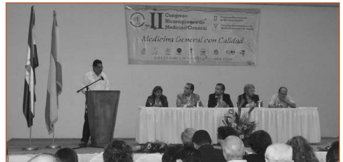
Acto inaugural del V Congreso Iberoamericano

Para la Unidad Clínico-Docente, la SEMG firmó un convenio con la Sociedad Española de Neumología y Cirugía Torácica (SEPAR) por el que esta sociedad científica dotaba a la