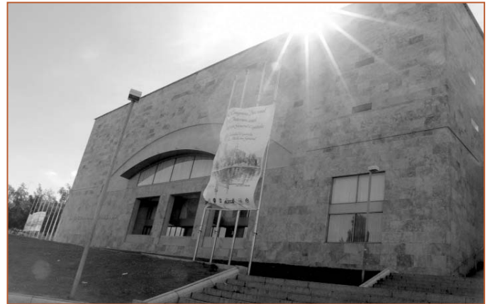
Vista del Palacio de Congresos de Salamanca

En el marco del Congreso anual se presentaba la candidatura encabezada por el doctor Benjamín Abarca para suceder al doctor José Manuel Solla en la presidencia, y ya se apuntaban las claves de la nueva etapa que se inauguraba: continuidad y renovación. La candidatura abanderada por el doctor