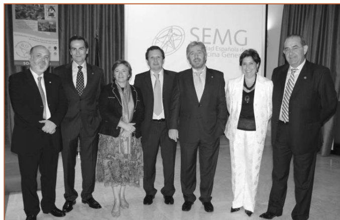
Los miembros de la Junta Directiva que asistieron al acto

En cuanto a la formación, la SEMG hizo un repaso del centenar de cursos presenciales realizados en el último año, en diferentes formatos, en los que se han acreditado más de 3.200 médicos, "lo que es todo un éxito", se congratulaba el vicepresidente de la SEMG,