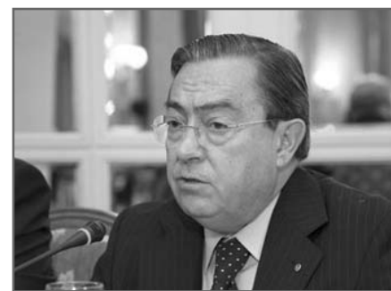
Isacio Siguero Presidente de la OMC

El documento pactado afirma que la autorización de prescripción al personal de enfermería podría originar una desestructuración de la asistencia al paciente, sin delimitación jerárquica de responsabilidades, afectando a la calidad del servicio, además de incrementar el gasto farmacéutico. Sostiene asimismo que cualquier estrategia que aumente de forma indiscriminada el consumo de medicamentos