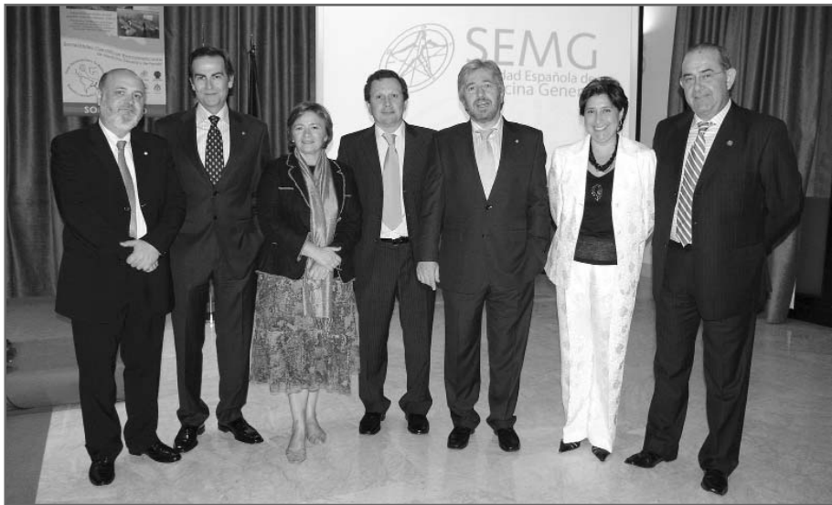
Imagen de los miembros de la Junta Directiva que acudieron al acto de presentación