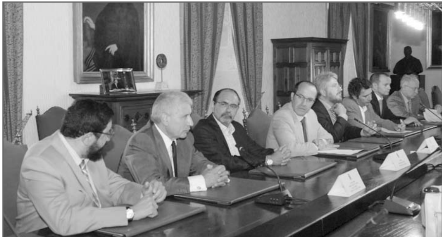
Momento de la firma del convenio entre la SEMG y la Universidad de Santiago

La Cátedra SEMG de Medicina de Familia ya se ha puesto en funcionamiento durante el último semestre del 2007. Además de lo previsto para el 2008 en PreGrado, la Cátedra SEMG, que se creó en el mes de julio del año pasado, incorpora ya una novedad: el desarrollo del Campus SEMG, previsto para los días 1, 2 y 3 de mayo del 2008, en la Facultad de Medicina de Santiago de Compostela. Su realización se llevará a cabo de manera intensiva, abordando en ella una selección de las técnicas y procedimientos que realiza habitualmente el médico general y de familia en su consulta.