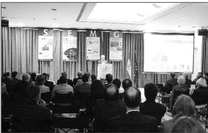
Momento de la presentación de la Junta realizada en Madrid