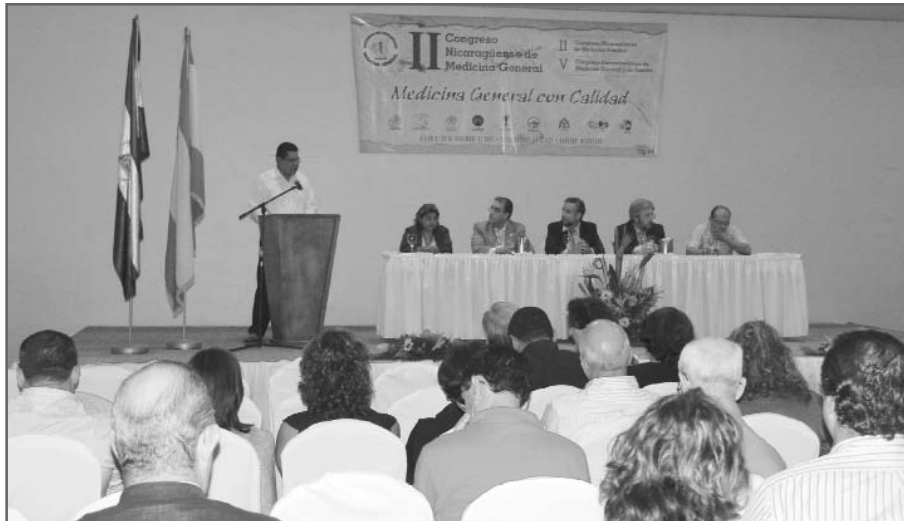
Momento del V Congreso Iberoamericano y II Nicaragüense de Medicina General y de Familia

Una vez clausurado el Congreso, un equipo de profesionales españoles recorrió distintas localidades de Nicaragua para impartir, durante diez días, diversos cursos prácticos y