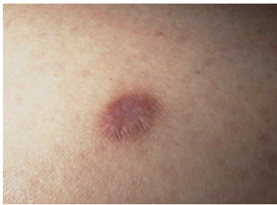
Figura 7. Lipoma

valorando su tamaño. Se extirparán aquellos que comiencen a tener unas dimensiones considerables y los que causen molestias, utilizándose para ello técnicas de cirugía escisional y subcutánea. Los localizados en la región sacra (asociación con espina bífida o meningocele) o facial o en zonas críticas deben ser derivados a cirugía plástica (figura 7).