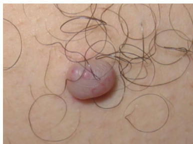
Figura 5. Nevo melanocítico congénito

Según su tamaño suelen clasificarse en pequeños (<1,5 cm; el 14,9% de las lesiones desarrollan melanoma), medianos (1,5-20 cm) y gigantes (>20 cm; el 40% de los melanomas aparecen sobre este tipo de nevos). Deben ser sometidos a un seguimiento continuo (medición o fotografiado), y a partir de la pubertad plantearse su extirpación. Se empezaría por aquellos en los que se hubiera producido cualquier cambio morfológico, utilizando técnicas de cirugía escisional (respetando los bordes). Si una lesión se transforma en un nevo displásico deberá realizarse derivación inmediata. Los nevos de gran tamaño precisarán de atención quirúrgica plástica (figura 5).