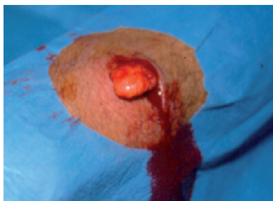
Figura 8. Complicaciones posquirúrgicas. Necrosis. Dehiscencia

tirar los puntos en la forma y el tiempo adecuados según las distintas localizaciones. El mayor riesgo ocurre precisamente en el momento de la retirada de los puntos.