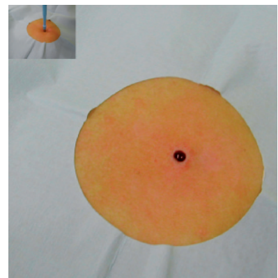
Figura 2. Fibroma blando

Conocido también como acrocordón o fibroma péndulo, es una lesión exofítica pediculada, filiforme y blanda, de peque-