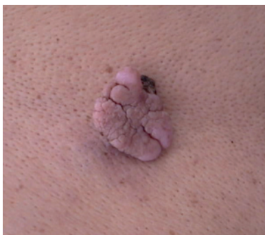
Figura 3. Queratosis seborreica

De entre las técnicas utilizadas en CM, las más utilizadas son la crioterapia