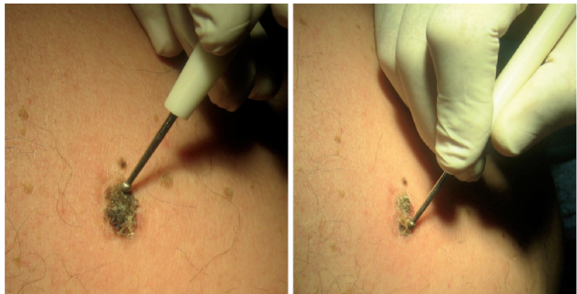
Figura 4. Hemangioma cutáneo

Granuloma piógeno o botriomicoma Lesión vascular seudotumoral adquirida, de crecimiento rápido, secundaria a una proliferación vascular reactiva a diferentes agentes. Se expresa mediante un nódulo único exofítico, de color rojo brillante o marrón-violáceo, asintomático, con un tamaño entre 0,5 y 1,5 cm, que sangra fácilmente al mínimo roce;