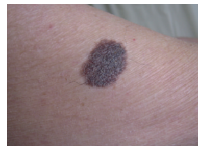
Figura 6. Dermatofibroma o histiocitoma

También conocido como histiocitoma, es un tumor benigno de origen fibroblástico. Se manifiesta como una lesión nodular benigna de origen dérmico o dermoepidérmico, única o en número